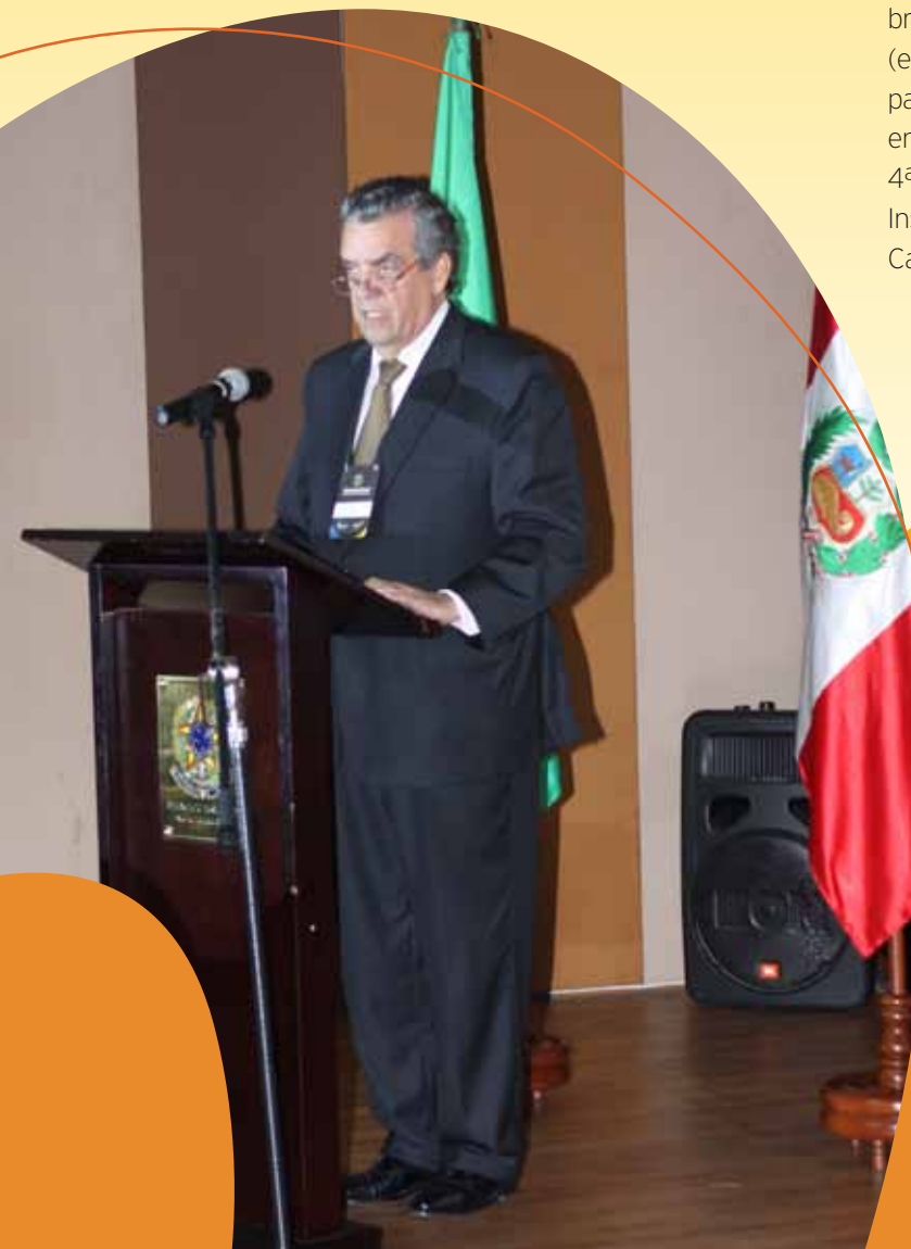
Embajador de Brasil Carlos Alfredo Lazary Teixeira

Las empresas brasileñas SRS Indústria e Comércio de Materiais Serigráficos Ltda. (máquinas y equipos para estampado) y Organiza Soluções em Software (software para gestión y control de procesos en la industria textil y de confecciones), así como FEBRATEX (Feria Brasileña para la Industria Textil), también participaron de la EXPOTEXTIL, con stands propios, esta última con la finalidad de divulgar evento que se realizará del 12 a 15 de agosto de 2014, en la ciudad de Blumenau en Santa Catarina ( http://www.febratex.com.br ).